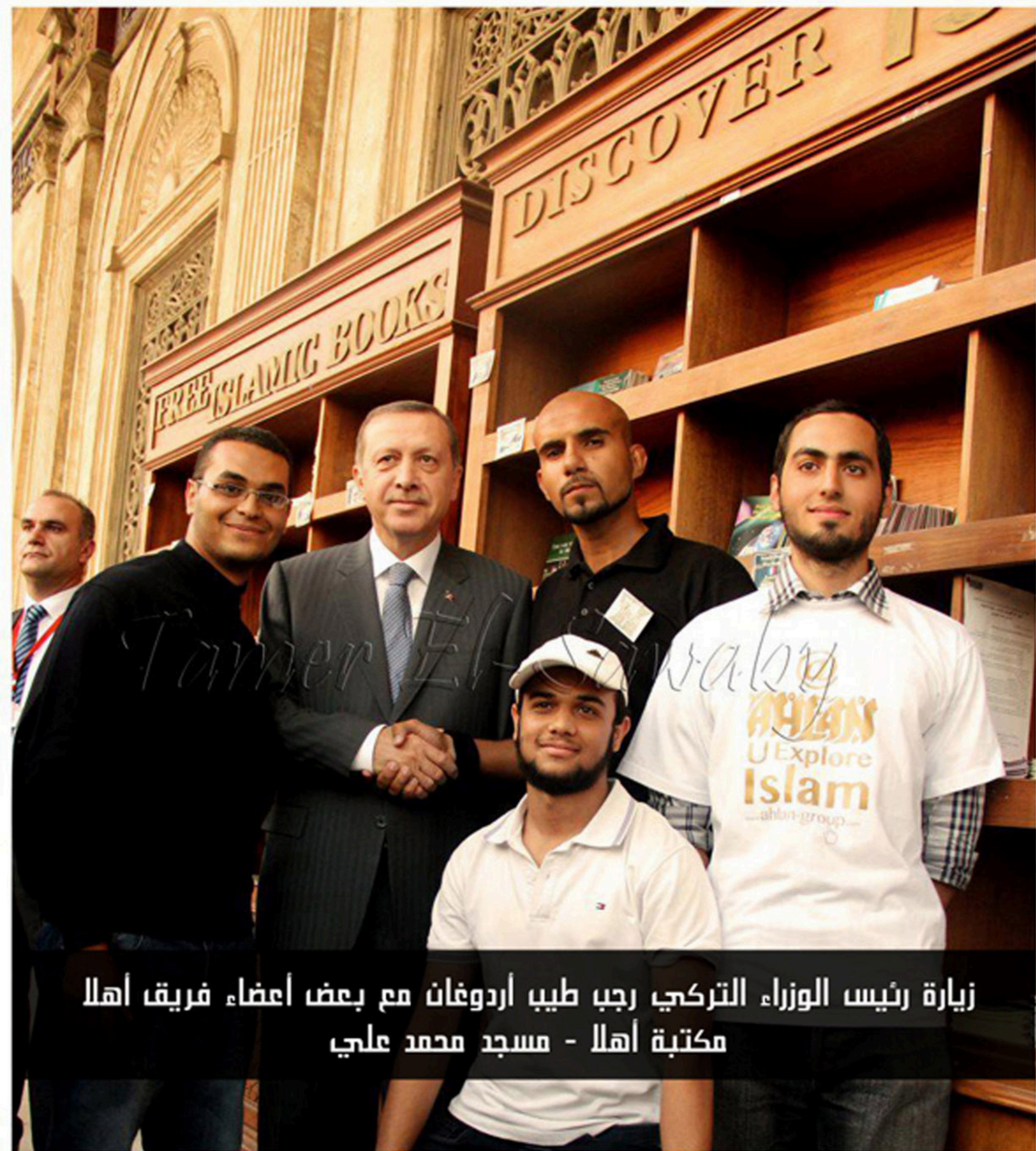
زيارة رئيس الوزراء التركي رجب طيب اردوغان مع بعض اعضاء فريق اهلا مكتبة اهلا - مسجد محمد علي