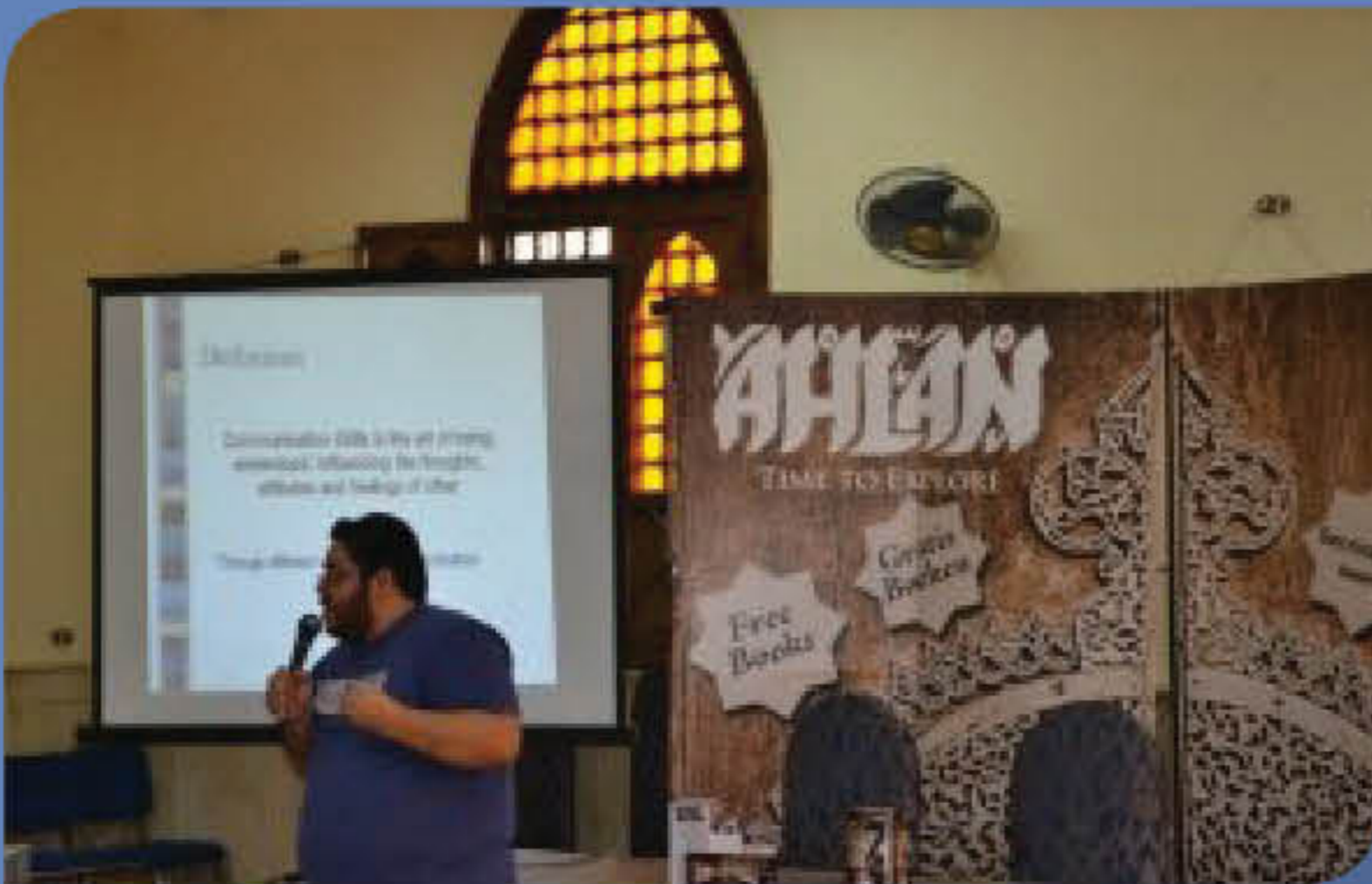
ندوة "لماذا اسلم هؤلاء؟"

١٦ نوفمبر، يوم مميز لنا فقد قامت أهلاً باستقبال متطوعين جدد والتعريف بها، والمميز في الأمر هو تكريم المتطوعين الذين بذلوا قصاري جهدهم خلال الفترة الماضية، فمنهم من سهر الليالي لإنجاز العمل ومنهم من بذل جهداً بالنهار لكي تصل الرسالة، ولكن تعالى معي أخي لنفكر، لقد بذلنا جهدنا ونبذله في العمل الذي نحتاج إليه في حياتنا ونعمل بكل طاقة لكي نرضي "المدير" أو "الشركة" أو الوصول للمهدف.. وليس خطأ بالطبع، ولكن المتطوعون في أهلاً يعملون لإرضاء الواحد الأحد، حقا هذا ما أريد أن أصل إليه في كلامي، بعض متطوعي أهلاً إن لم يكن جميعهم لديهم وظائفهم الخاصة وكل منا له حياته الشخصية ولكن ماذا عن الإسلام؟ لماذا لا نضعه وظيفة نعيش لها؟ ما قيمة الحياة أخي المسلم إذا كان ما تقوم به من وقت الاستيقاظ للنوم هو إفادة نفسك؟ أين دينك والحمية له؟ لماذا لا تضع وقتاً لله؟ فقط في سبيل الله..