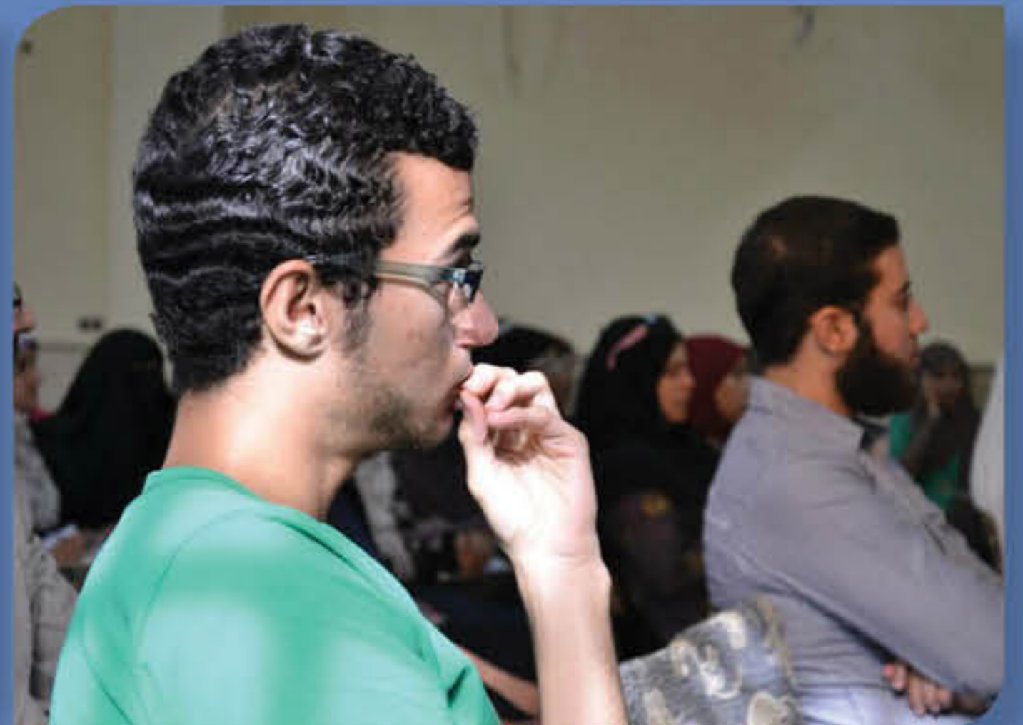
أهلاً في يوم استقبال للمتطوعين الجدد وتكریم أفضل متطوع ومتطوعه